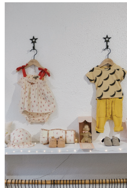
32 ÉMILE ET IDA - décoration de l'enseigne