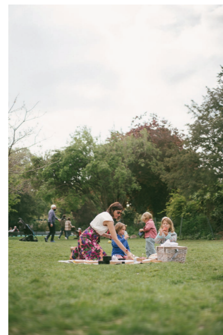
21 LIEU DU PIQUE - NIQUE