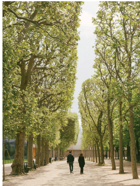
06 TOUR EIFFE - visites de Paris