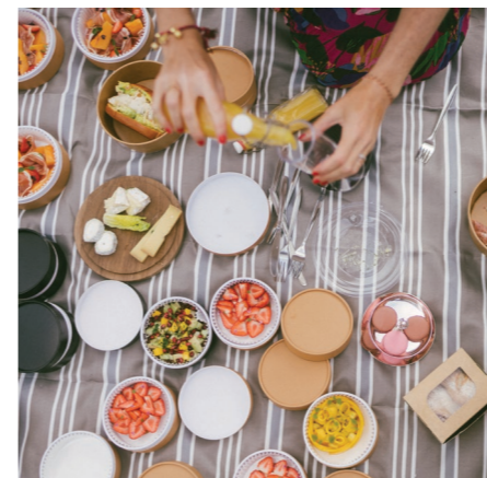
20 PIQUE-NIQUE - produits locaux