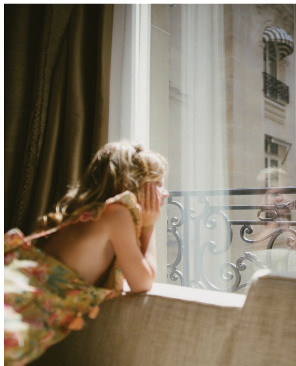
35 L' HÔTEL DE CRILLON, A ROSEWOOD HOTEL

L' Hôtel de Crillon, illustre édifice dominant la Place de la Concorde, célèbre l'esprit de Paris et l'art de vivre à la française : il est intemporel, légendaire, et élégant. En 2013 commencent des travaux de rénovations visant à renforcer le grandeur et l'élégance de ce trésor architectural néoclassique, tout en préservant le caractère prestigieux de ce bâtiment du XVIIIe siècle. Après 4 années de rénovation, l'hôtel de Crillon rouvre ses portes en 2017.