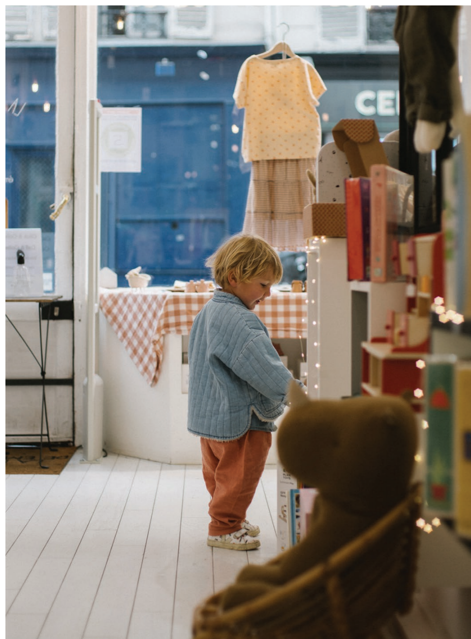
31 ÉMILE ET IDA - vêtements pour enfants