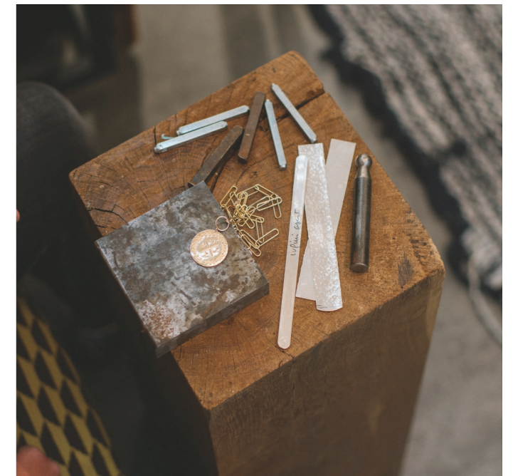
25 PAR COEUR - gravure