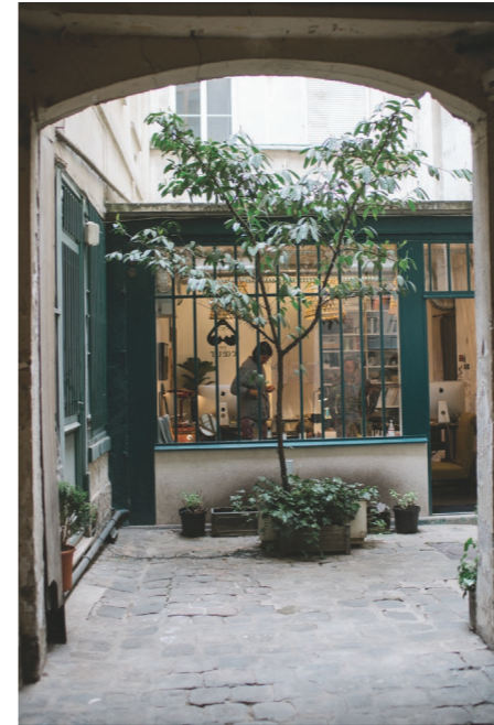
24 PAR COEUR - devanture de l'enseigne

"Ils créent des bijoux personnalisés sur lesquels vous pouvez graver le nom de vos enfants. Ils y mettent leur cœur et tout leur art" — A