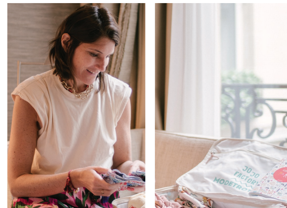
14 AMANDINE - organisation des valises