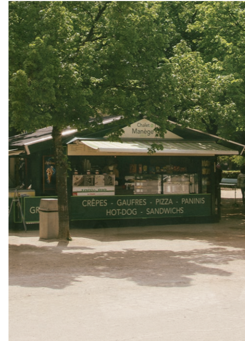
05 CHAMP-DE-MARS - à la découverte de Paris

La plupart des gens ignorent l'aspect familial de Paris. Selon vous, à quoi ressemble une journée idéale en famille à Paris ?