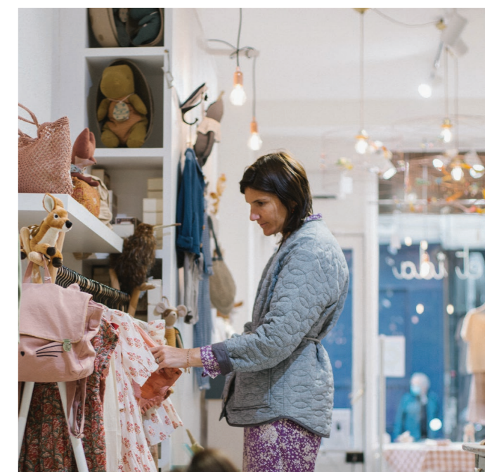
33 ÉMILIE ET IDA - mode enfantine

Chez Émile et Ida, la qualité des matières et le confort priment. Ils créent des pièces intemporelles pour les bébés, les enfants et pour les femmes, dans des matières douces et naturelles. Et tout est fabriqué en Europe. La marque possède trois magasins physiques (dont deux à Paris), sinon on peut la retrouver au Bon Marché à Paris ou chez Barney’s aux États-Unis.