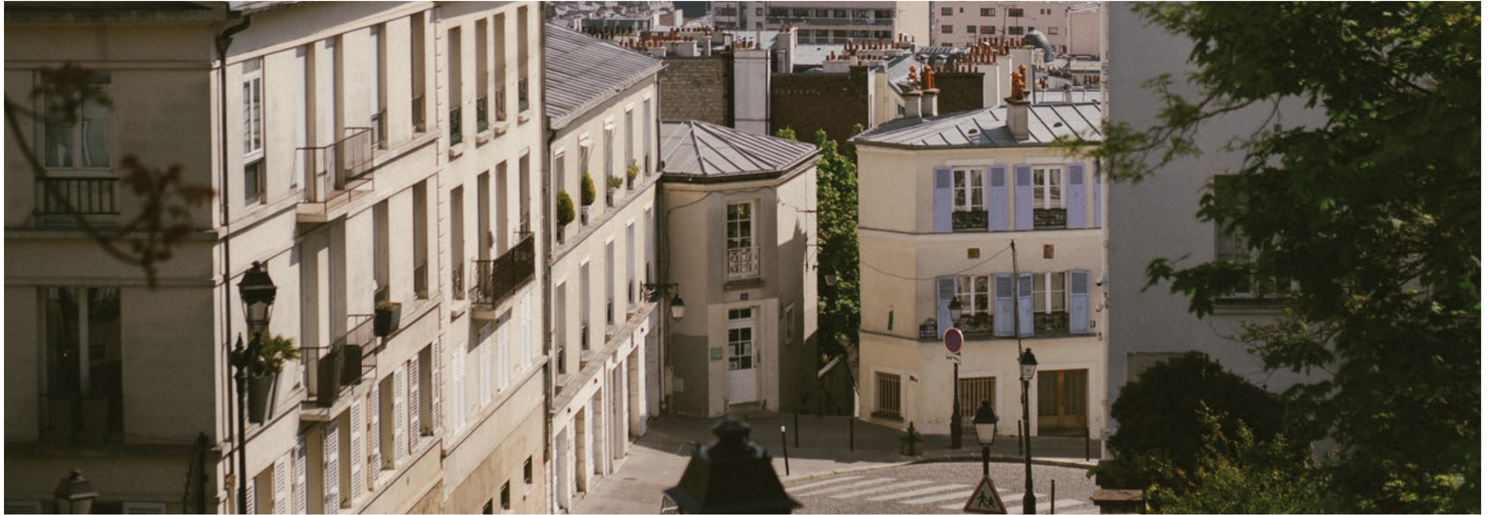
18 HORIZON PARISIEN - vue depuis Montmartre