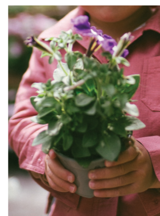
12 MARCHÉ AUX FLEURS - à la découverte du